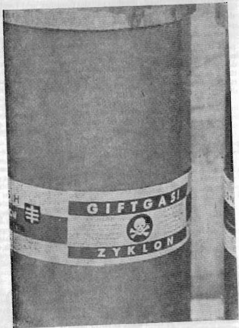
Envase de gas cianhídrico CICLON, el preparado letal utilizado en las cámaras de la muerte (camufladas como "salas de baños"). Los verdugos nazis instalaban el volátil fluido venenoso en el interior de las cámaras —herméticamente cerradas— a través de las "duchas".

700 detenidos estuvieron trabajando durante cinco semanas en la erección del edificio del nuevo combinado de la muerte. En el momento álgido de los trabajos llegó desde Alemania un maestro con su brigada y procedió al montaje. Las nuevas cámaras, en número total de diez, se extendían de manera simétrica a ambos lados de un amplio corredor de cemento. En cada una de las cámaras, de igual manera que en las tres que les antecedieron, había dos puertas, la primera, que daba al corredor, por la que se metía la gente viva y la otra colocada paralelamente, abierta en el muro opuesto, que servía para extraer los cadáveres de los "gaseados". Estas puertas daban a una de las dos plataformas especiales colocadas simétricamente por ambos lados del edificio. Hasta la plataforma llegaban unas vías de trocha angosta. De esta manera los cadáveres caían por sí solos a la plataforma y desde allí, inmediatamente después, se los cargaba en vagonetas y se les llevaba al enorme sepulcro que de día y de noche estaba abriendo la excavadora colosal. El suelo de las cámaras estaba construido con gran pendiente desde el corredor hasta la plataforma, lo que aceleraba mucho el trabajo de descarga. En las cámaras viejas se descargaba los cadáveres de manera primitiva. Se los llevaban en angarillas y los arrastraban con correas. La superficie de cada cámara era de 7 por 8 metros, es decir, de 56 metros cuadrados. La superficie total de las nuevas diez cámaras alcanzaba a 560 metros cuadrados, y