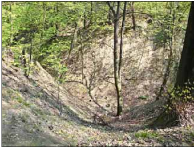
Babi Yar (Abril de 2009)

Con formato: Fuente: (Predeterminado) Arial, 10 pt, Color de fuente: Color personalizado(RGB(74,68,42))