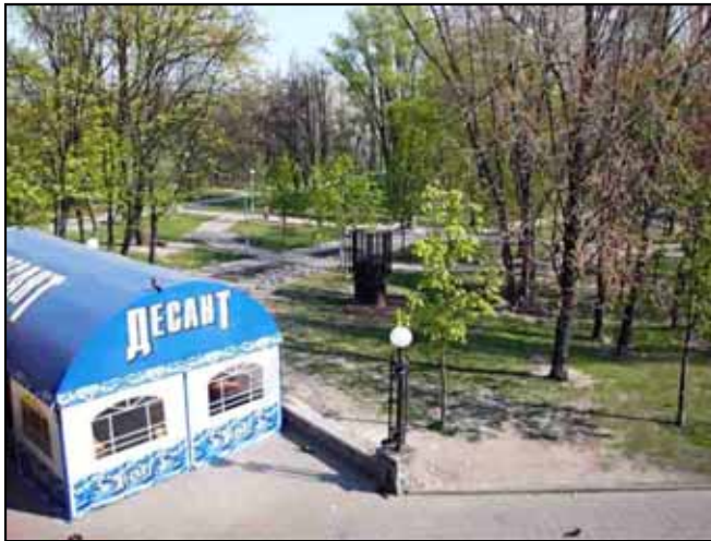
Babi Yar (Abril de 2009)

emblemático es Babi Yar en Kiev, (allí fueron asesinados más de 100.000 personas) donde el sitio de matanza se convirtió en un parque público durante el período soviético – actualmente, el Consejo Judío de Ucrania, está llevando a cabo un proyecto de museo en el sitio.